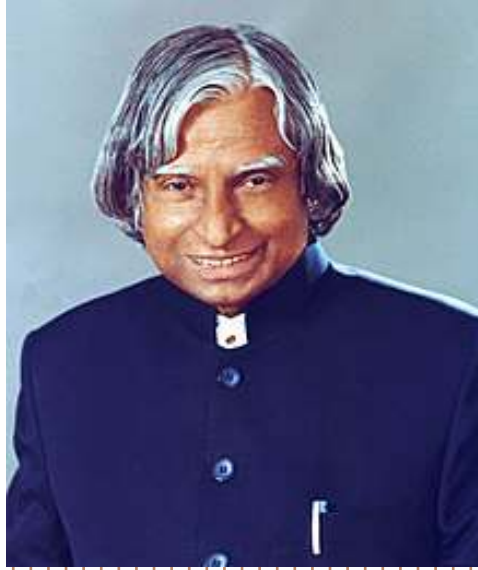
Avul Pakir Jainulabdeen Abdi Kalam

Postal Regd. No. AND/318/2021-23 RNI Regd. No. Guj/2009-11/5433 Posted at Vallabh Vidyanagar on 5 th of Every Month